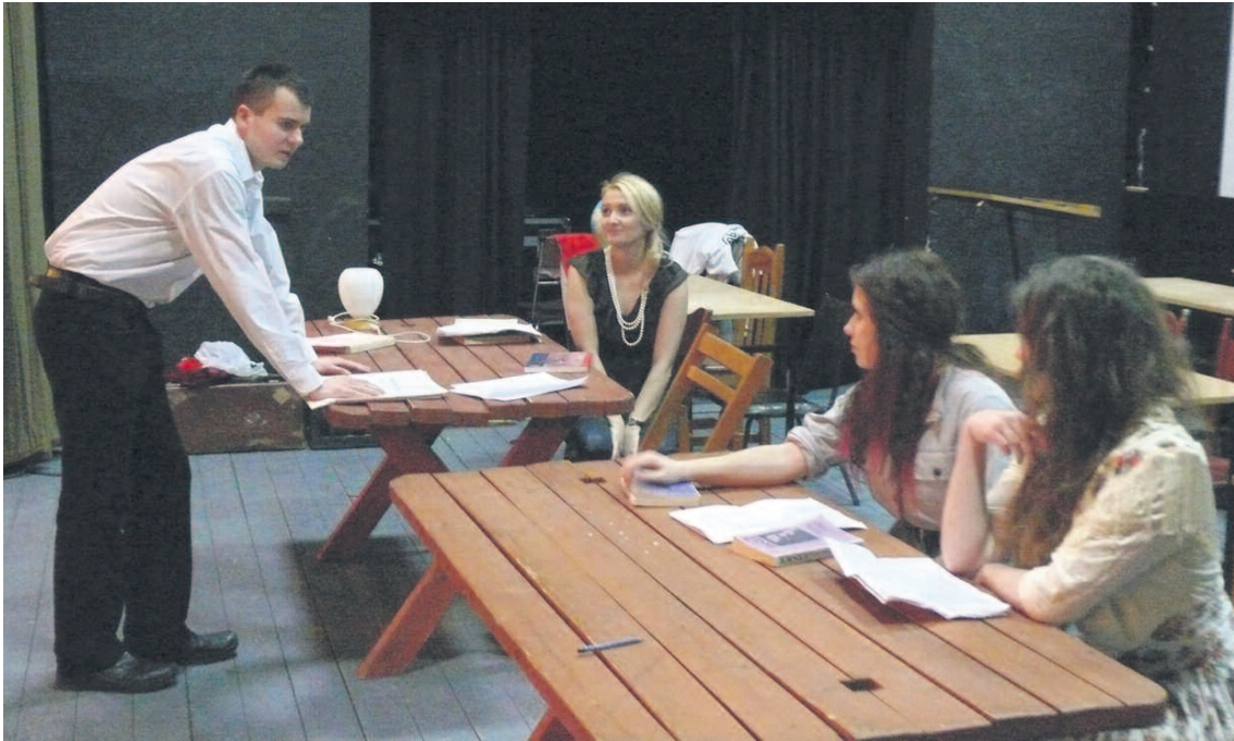
Próby do spektaklu trwają już od kilku tygodni.