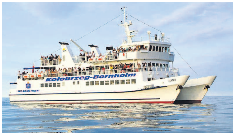
Wstępnie ustalono, że widoczny na zdjęciu katamaran Jantar będzie wypływał z Darłowa w każdy czwartek w lipcu i sierpniu.

– Udało się przekonać Kołobrzeską Żeglugę Pasażerską, która od wielu lat obsługuje połączenia Kołobrzegu z Bornholmem, aby uruchomiła też rejsy z naszego portu