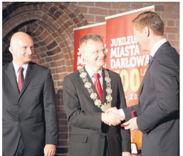
Najważniejsze uroczystości zorganizowano w kościele mariackim, gdzie burmistrz zaprosił między innymi wojewodę i marszałka.

Jako ostatni głos zabrał honorowy obywatel Darłowa Marek Krajewski, który w pięknej mowie