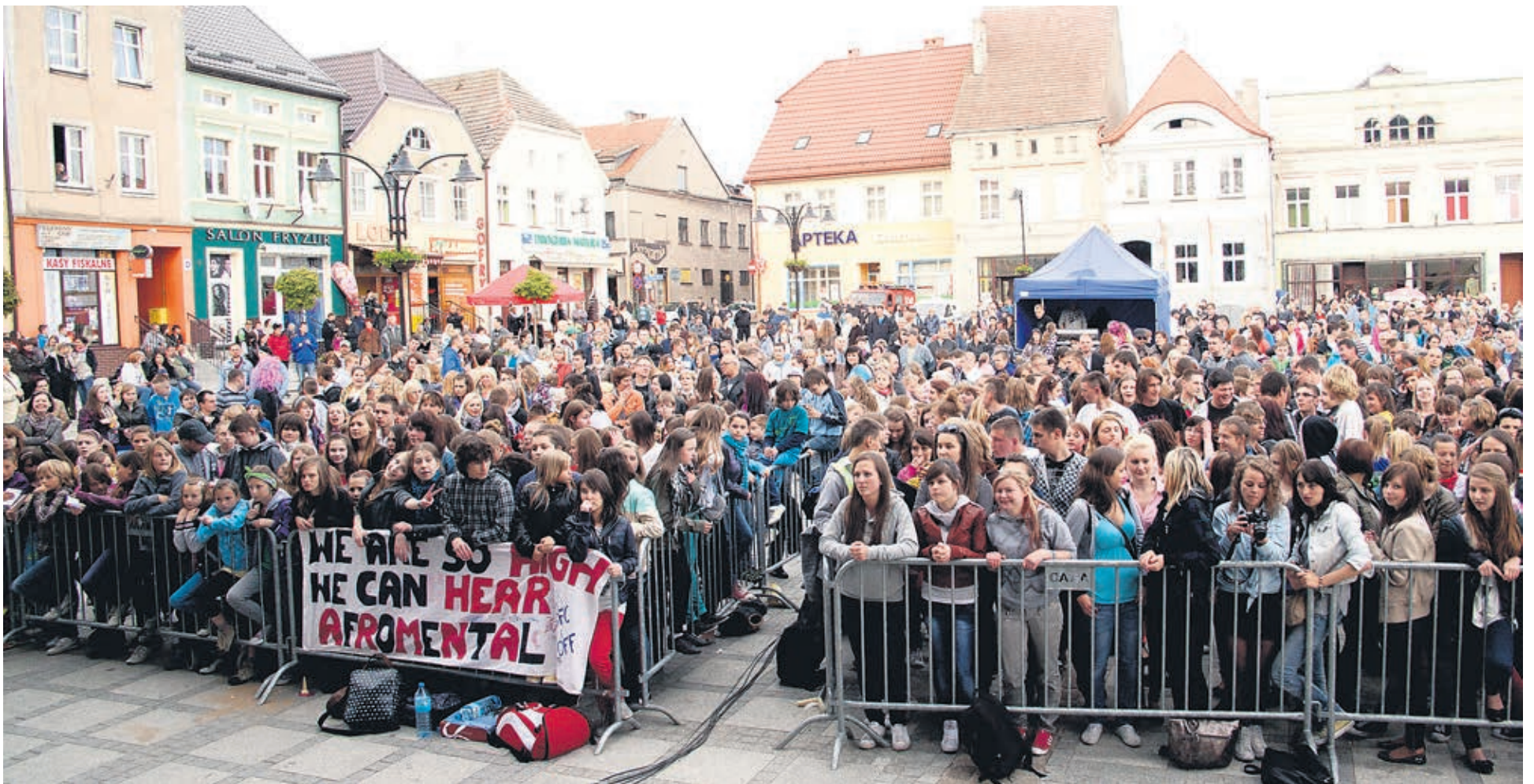
Jubileusz 700-lecia był okazją do świetnej zabawy dla wielu mieszkańców.

O wszystkie pamiątki przeszłości staramy się ciągle troszczyć, zachować je i przekazać następnym pokoleniom – mówi burmistrz Darłowa podczas uroczystej akademii z okazji 700-lecia miasta.