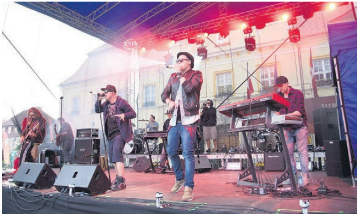
Afromental na scenie przed darłowskim ratuszem rozgrzał licznie zgromadzoną publiczność.