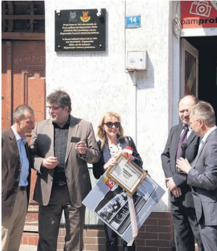
Dzięki tablicy na ścianie budynku zagraniczni goście będą mogli odnaleźć miejsce, gdzie dawniej produkowano słynną kiełbasę.

Tablica z herbem Darłowa i logiem firmy posiada dwujęzyczne napisy: „W tym domu do 1945 roku znajdowała się firma wędliniarska Rügenwalder Mühle (Darłowski Młyn) produkująca słynną Rügenwalder Teewurst (Darłowska Kiełbasa)”. Właścicielowi firmy wędliniarskiej burmistrz miasta wręczył certyfikat członka Klubu Przyjaciół Darłowa. Podczas odsłonięcia tablicy często wano przechodniów kanapkami z herbacianą kiełbasą. ●