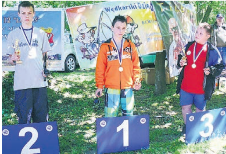
Za nami już wędkarski Dzień Dziecka (na zdjęciu zwycięzcy mistrzostw Darłowskiej Szkółki Wędkarskiej). W najbliższy weekend nie zabraknie atrakcji na Wyspie Łososiowej i przy Szkole Podstawowej nr 3.

O tym, że naprawdę warto wybrać się na obie imprezy najlepiej wiedzą uczestnicy wędkarskiego Dnia Dziecka, który z rozmachem zorganizowano w minioną niedzielę przy stawie