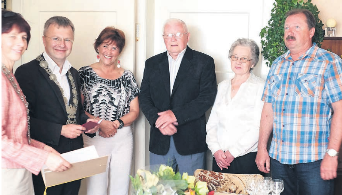
Z okazji jubileuszu burmistrz miasta w imieniu Prezydenta RP uhonorował jubilatów Medalami za Długoletnie Pożycie Małżeńskie.