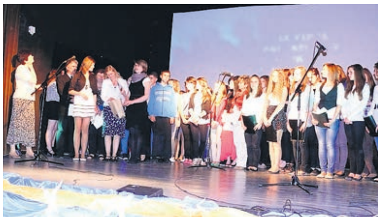
Tak duże zainteresowanie konkursem świadczy o tym, że wielu młodych ludzi lubi poezję