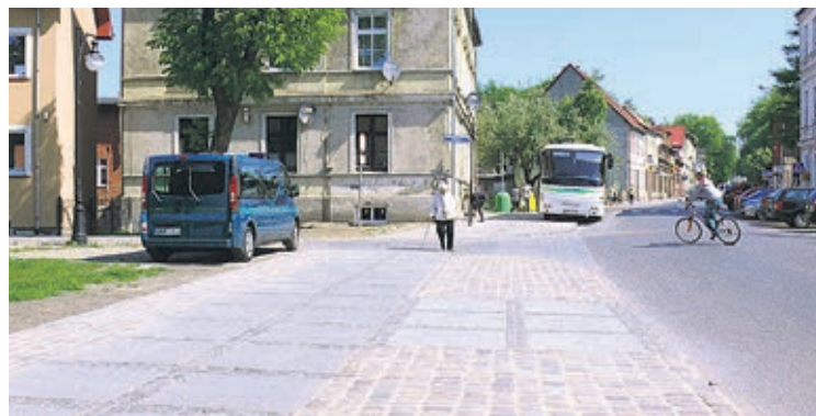
Wyremontowano też chodnik na ulicy o. Damiana Tynieckiego koło bramy miejskiej.