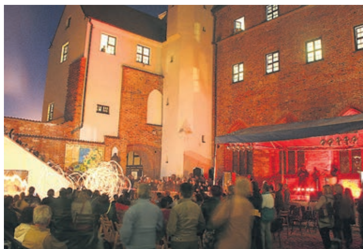
Uroczystości zbiegły się z imprezami z okazji Nocy Muzeów. Występy na zamkowej scenie trwały do późnego wieczora.