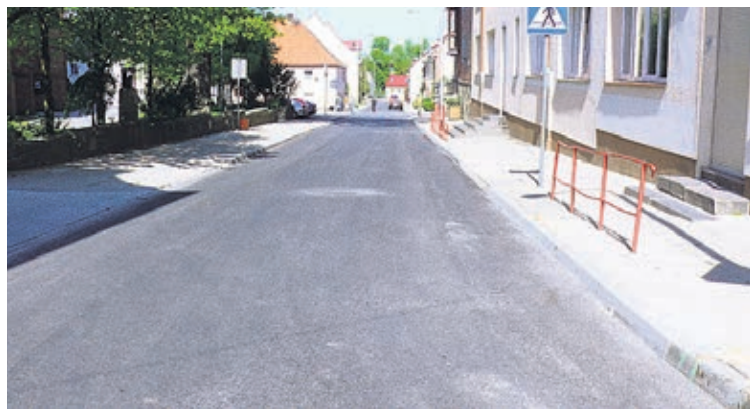
Tak prezentuje się wyremontowana ulica Franciszkańska.

tarzem i odcinka ulicy Św. Gertrudy od placu do ul. H. Wieniawskiego oraz części ul. Młyńskiej od ul. Hotelowej do Wałowej. Prace te niewątpliwie poprawią komfort jazdy kierowcom. ●