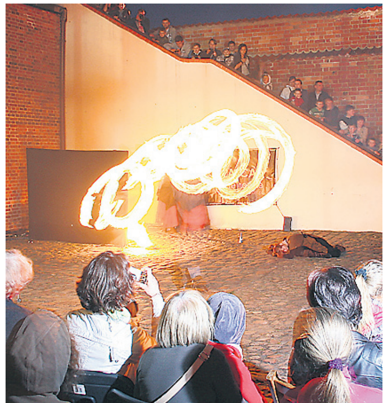
Goście mogli obserwować m.in. widowiskowe pokazy ognia.