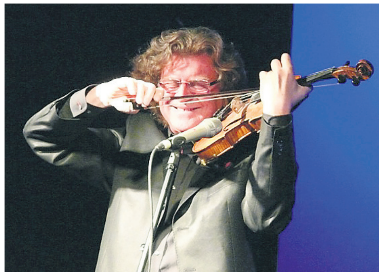
Zbigniew Wodecki jak zwykle oczarował publiczność – znany muzyk wystąpił w kinie Bajka.