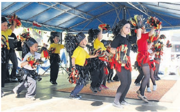
Program składał się z wierszy i piosenek o mamie i tacie.