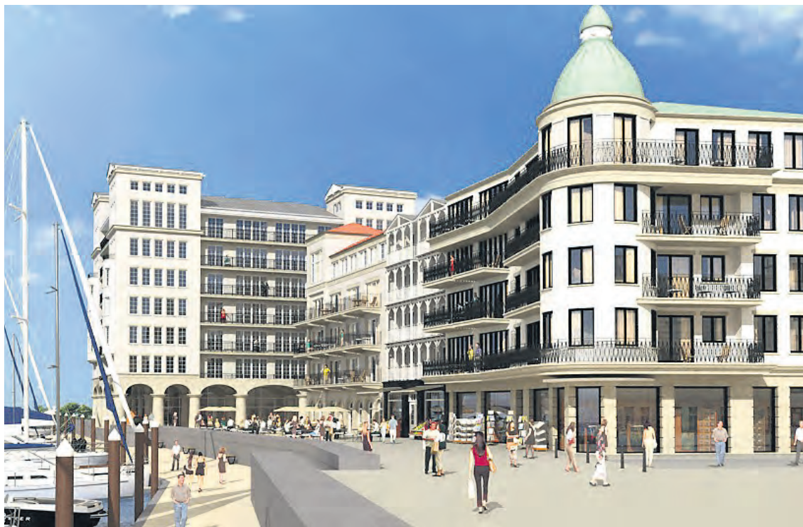
Tak za kilka lat będzie wyglądać „Marina Darłówek”.

Belgijska firma deweloperska POC Partners, która 2 lata temu kupiła od miasta za 15 milionów złotych teren w porcie wkrótce ruszy z budową.