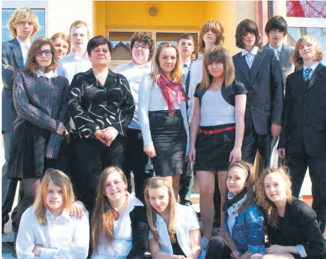
Stres szybko zniknął po egzaminie – śmiali się gimnazjaliści szkoły społecznej.

Wielu uczniów przed egzaminami powtarzało materiał. Niektórzy byli spięci i zestresowani, a inni rozluźnieni. Kiedy wybił czas ubrani na galowo ustawiliśmy się w porządku alfabetycznym przed salą, w której mieliśmy rozwiązywać testy. Wielu moich kolegów skończyło egzaminy przed wyznaczonym czasem. Gdy zegar wybił dziesiątą odłożyliśmy długopisy i komisja zebrała arkusze. Pomiedzy testami mieliśmy czterdziestominutową przerwę, podczas której trójka klasowa przygotowała nam poczęstunek, abyśmy mogli nabrać siły i odpocząć. Nasze odpowiedzi spisaliśmy na karteczki