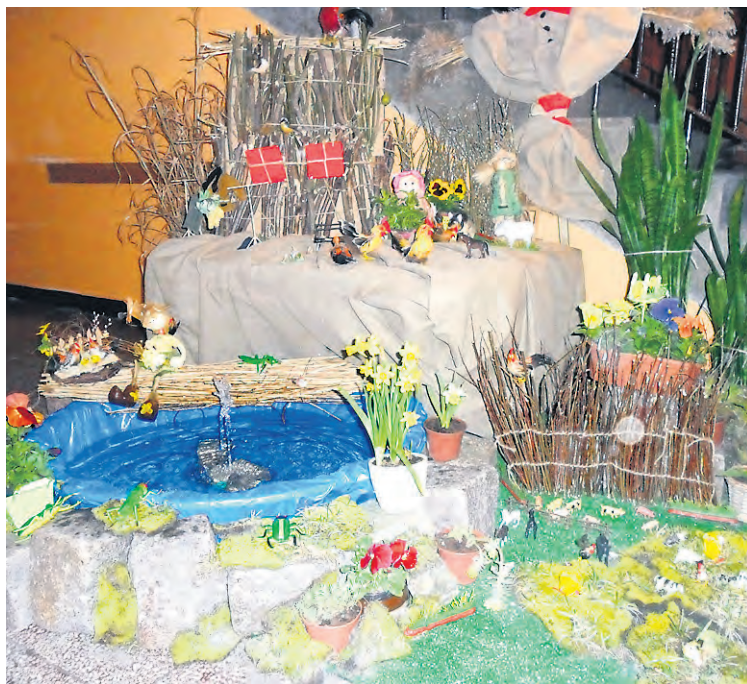
Tak prezentuje się obecnie jeden z korytarzy szkoły społecznej.

Bywają też pomysły, które są już wpisane w harmonogram szkolny. Dla przykładu powiem o choinkach, żywych Mikołajach, czy girlandach światełek spływających ze ścian w okresie bożonarodzeniowym. Podobnym cyklicznym przedsięwzięciem jest