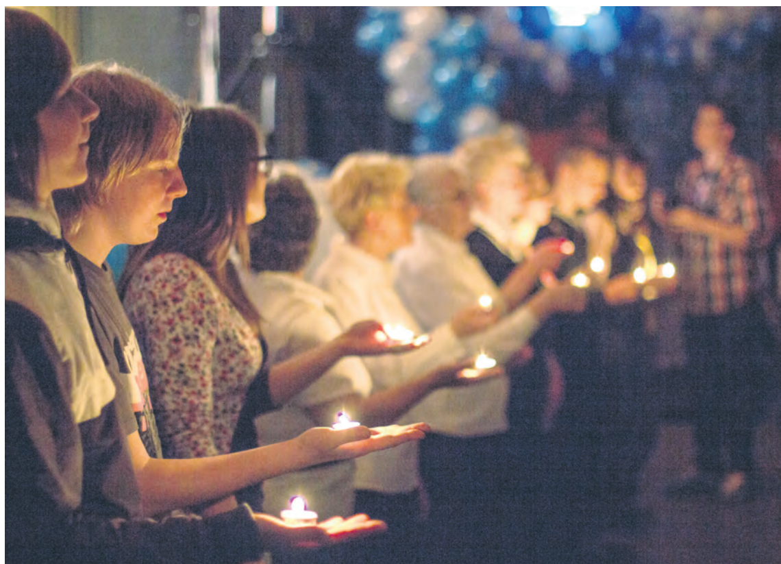
Uczestnicy finału stworzyli niepowtarzalną atmosferę zapalając kilkadziesiąt świec.