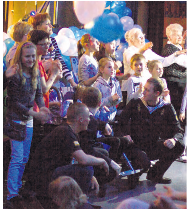
W zdjęciach do klipu wzięło udział blisko 300 wolontariuszy.

Zapraszamy do oglądania! My Sami o nas SAMYCH. Koniecznie polubcie nas na oficjalnym fanpage'u www.facebook.com/SAMIdarlowo .