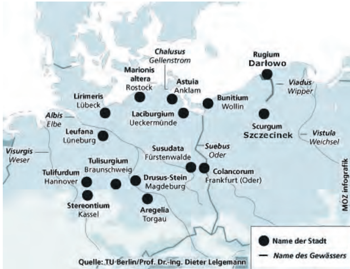
Na karty dziejów trafiło Darłowo, jako Rugium już w pierwszej połowie II wieku n.e.

Pierwsze ślady pobytu pierwszych ludzi na ziemi darłowskiej pochodzą sprzed 10 tysięcy lat. Liczne wykopaliska archeologiczne potwierdzają, że ten obszar zamieszkiwali Słowianie od ok. 4500 lat. Na karty dziejów trafiło Darłowo, jako Rugium już w pierwszej połowie II wieku n.e. Umieścił je na swej mapie Klaudiusz Ptolemeusz – geograf Aleksandryjski. Biegła tu jedna z tras słowiańskiego Szlaku Bursztynowego prowadzącego z Akwilei przez Wiedeń, do Bałtyku. Tu również do ujścia rzeki Wieprzy – (Viadua) dopływali kupcy greccy i rzymscy w poszukiwaniu jantaru. Rugion – siedziba Rugiów znajdowała się w pobliżu ujścia rzeki Grabowej do Wieprzy. O korzeniach Darłowa sprzed dwóch tysięcy lat pisałem kilka lat temu. Obecnie interdyscyplinarne badania naukowców niemieckich doprowadziły do reinterpretacji wielu dotychczasowych ustaleń. Mają one wpływ na dotychczasową wiedzę o starożytnych miejscowościach położonych na ziemiach polskich. Dotyczy to m.in.: Bydgoszczy, Darłowa, Szczecinka i rzek Odry (Suebus) i Wieprzy (Viadua). POYTION tak