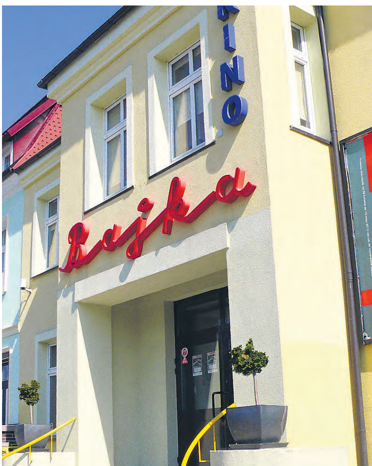
Życie kulturalne miasta skupia się głównie w kinie Bajka.

Warunkiem ukończenia konkursu było przejście 5 rund sprawdzających podstawową wiedzę drużyn na temat Grup Szturmowych, Pogotowia Harcerskiego, tajnego nauczania, Akcji „M”, „kotwicy” Polski Walczącej, kryptonimów struktur Szarych Szeregów, haseł, takich jak WISS, ZHP, „Mafeking” i „Wawer”, obszarów działań Uli „Wiśła”, „Przemysław” i „Lew”, oraz znajomość harcerskich pieśni. O przebrnięciu przez etapy decydowała wiedza oraz refleks uczestników.