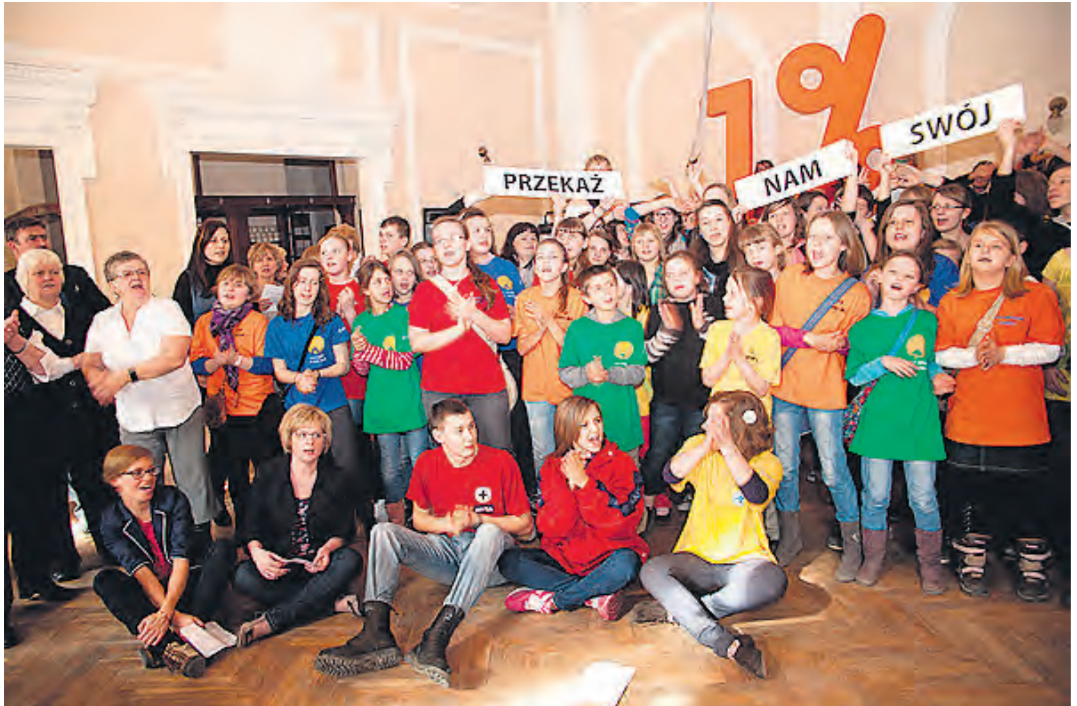
Kręcenie teledysku było doskonałą zabawą – cieszyli się wolontariusze.