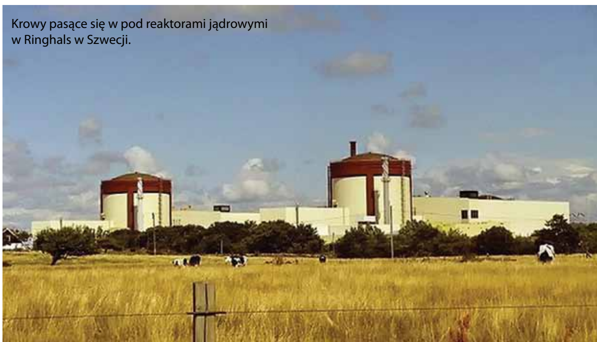
Krowy pasące się w pod reaktorami jądrowymi w Ringhals w Szwecji.