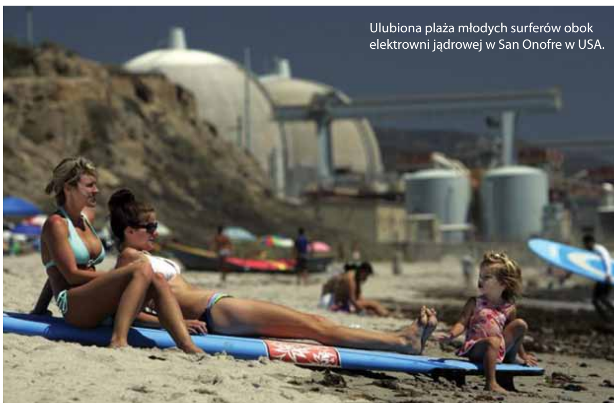
Ulubiona plaża młodych surferów obok elektrowni jądrowej w San Onofre w USA.