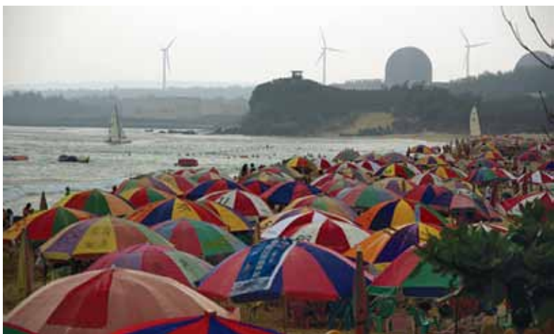
Plaża na Tajwanie. W tle elektrownia jądrowa Mannsham.