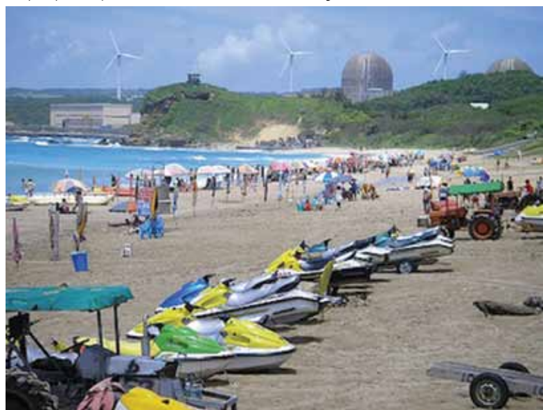
W tle elektrownia jądrowa Mannsham. Tajwan.

Analiza wykonana na zlecenie kancelarii Senatu RP w 2009 roku wykazała, w oparciu o materiały z 27 państw świata, że „nie znaleziono żadnych przykładów świadczących o tym, że usytuowanie elektrowni atomowej wpływa negatywnie na ruch turystyczny w danej miejscowości. Wręcz przeciwnie - pokazano, że obecność takiej elektrowni może stymulować wzrost liczby turystów (Belgia, Francja, Czechy, Szwecja).”