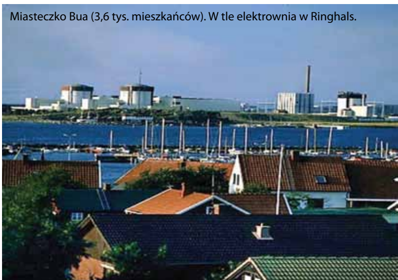
Miasteczko Bua (3,6 tys. mieszkańców). W tle elektrownia w Ringhals.