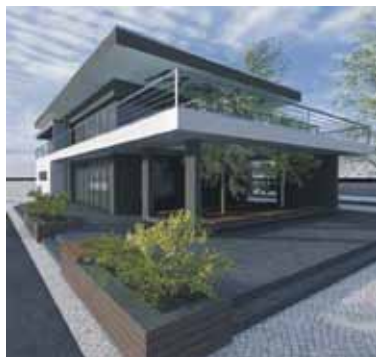
Tak będzie wkrótce wyglądał budynek przy basenie rybackim.

ła 1.781.972,77 zł. Dwukondygnacyjny budynek sanitarno - socjalny o powierzchni użytkowej prawie 300 m2 zostanie wzniesiony przy basenie rybackim w Darłównie wschodnim.