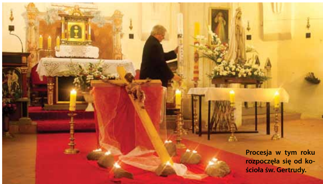
Procesja w tym roku rozpoczęła się od kościoła św. Gertrudy.