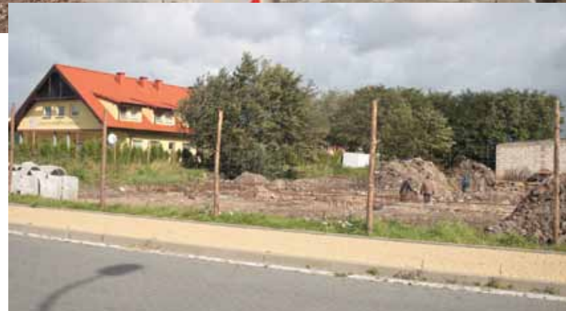
Budowa boksów rybackich i świetlicy dla użytkowników portu w Darłównie Zachodnim. Na tą inwestycję miejska spółka Zarząd Portu Morskiego pozyskała dotację z unijnego programu rybackiego.