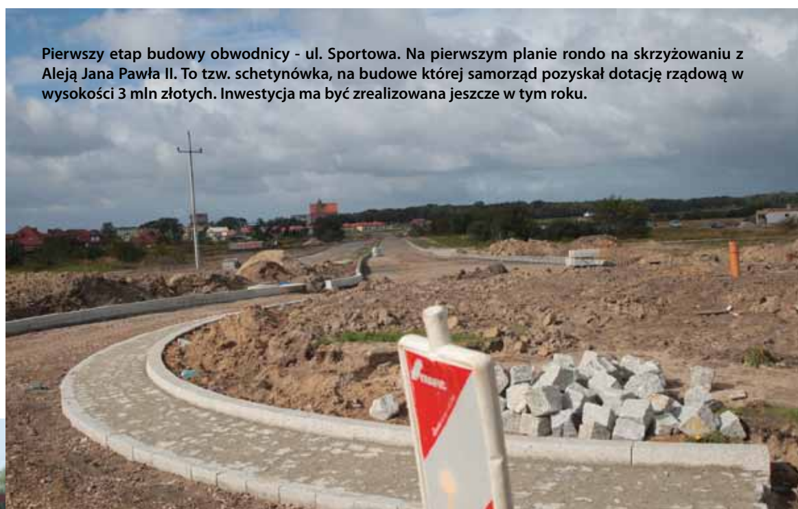
Pierwszy etap budowy obwodnicy - ul. Sportowa. Na pierwszym planie rondo na skrzyżowaniu z Aleją Jana Pawła II. To tzw. schetynówka, na budowę której samorząd pozyskał dotację rządową w wysokości 3 mln złotych. Inwestycja ma być zrealizowana jeszcze w tym roku.