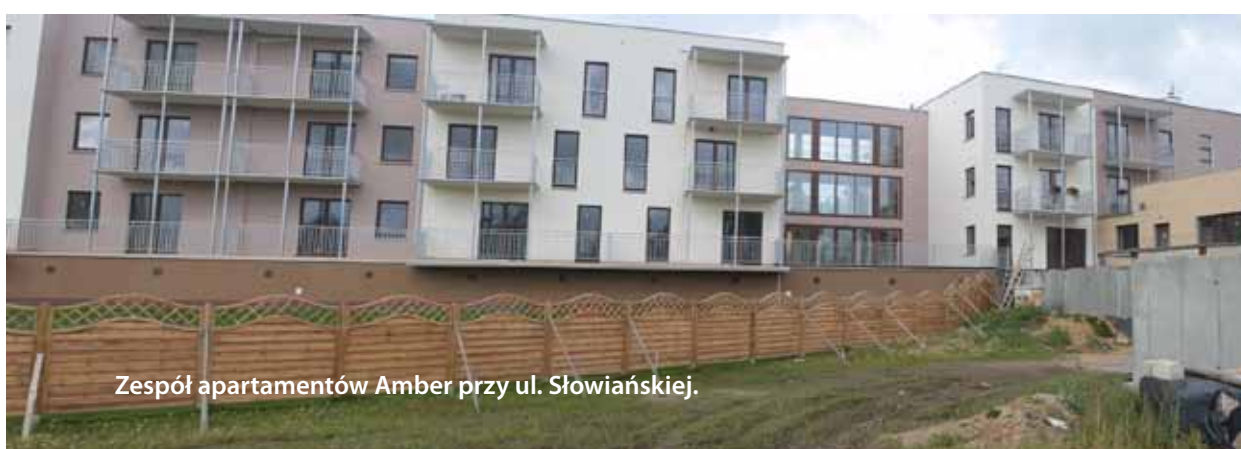
Zespół apartamentów Amber przy ul. Słowiańskiej.