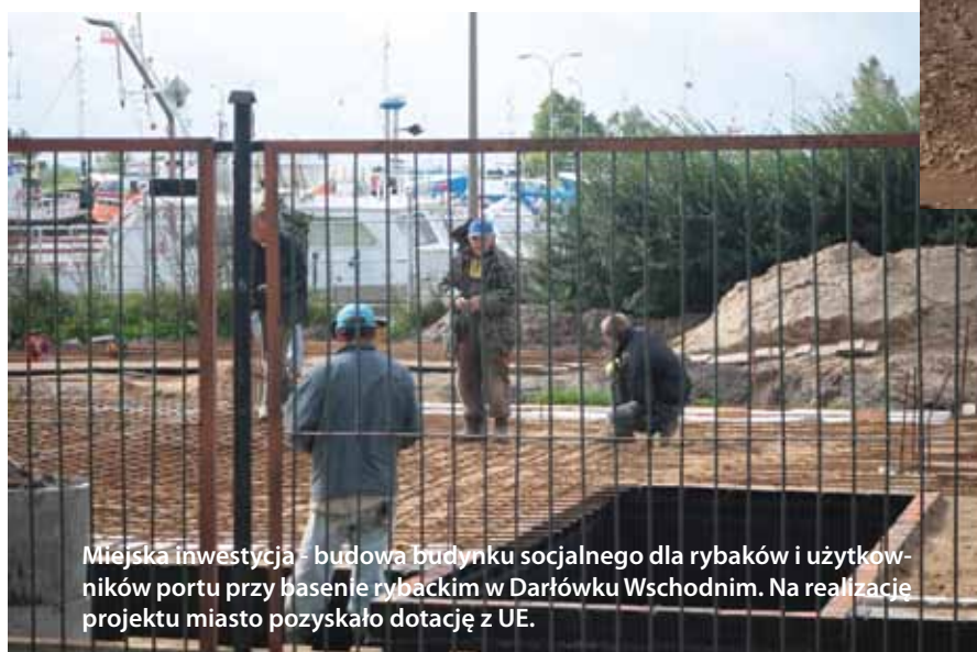
Miejska inwestycja - budowa budynku socjalnego dla rybaków i użytkowników portu przy basenie rybackim w Darłównie Wschodnim. Na realizację projektu miasto pozyskało dotację z UE.