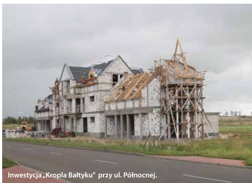
Inwestycja „Kropla Bałtyku” przy ul. Północnej.