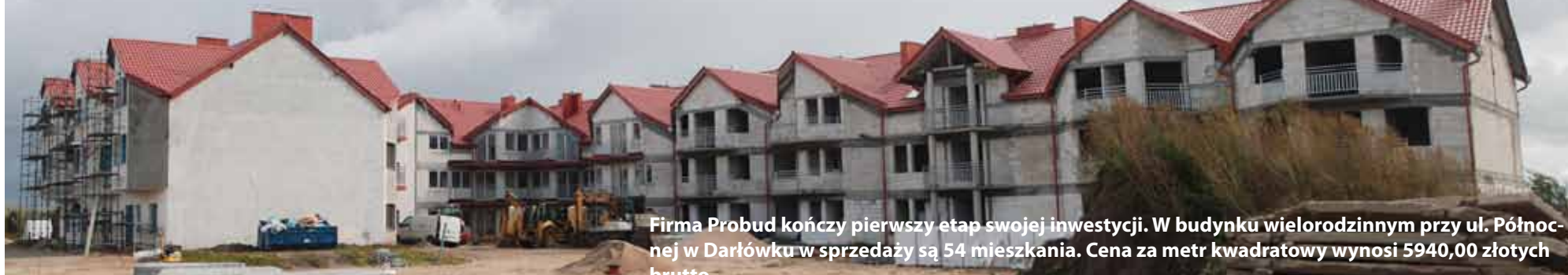
Firma Probud kończy pierwszy etap swojej inwestycji. W budynku wielorodzinnym przy ul. Północnej w Darłównie w sprzedaży są 54 mieszkania. Cena za metr kwadratowy wynosi 5940,00 złotych brutto.