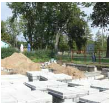
Wylano już fundamenty ...

Wybrano najkorzystniejszą ofertę Przedsiębiorstwa Produkcyjnego „SELFA”. Kosztorysowa wartość tego zadania inwestycyjnego wynosi-