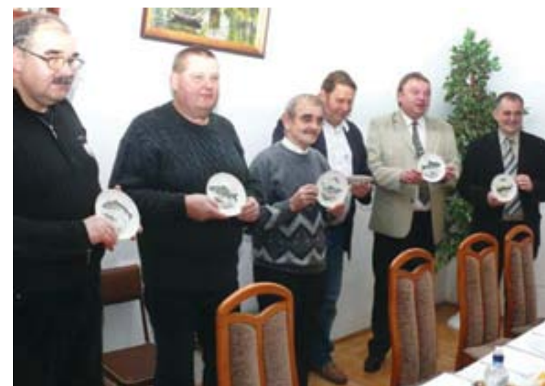
W trakcie spotkania świątecznego w Darłowskim kole PZW pamiątkowymi paterami wyróżniono osoby wspierające wędkarzy... a zarząd koła otrzymał od burmistrza ozdobione motywami wędkarskimi talerzyki.