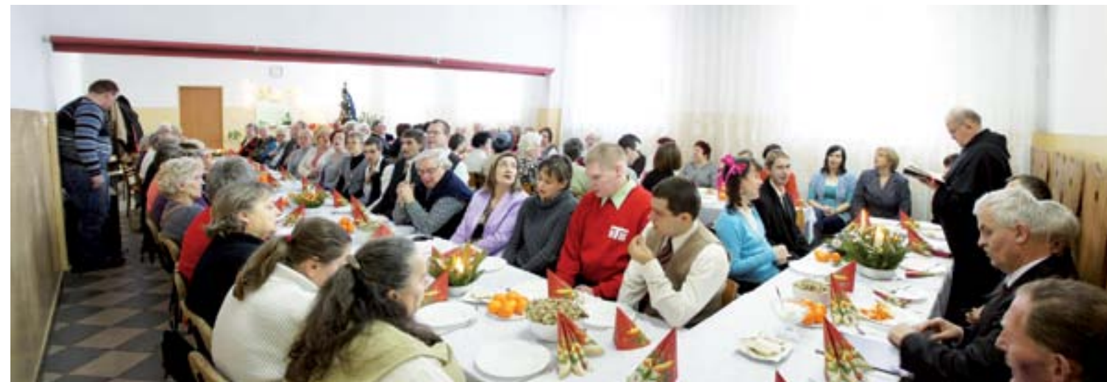
Darłowski MOPS zorganizował spotkanie opłatkowe dla osób niepełnosprawnych i seniorów.