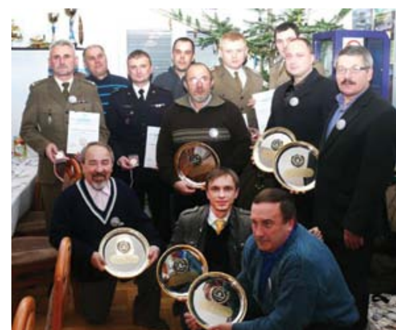
W trakcie spotkania świątecznego w Darłowskim kole PZW pamiątkowymi paterami wyróżniono osoby wspierające wędkarzy... a zarząd koła otrzymał od burmistrza ozdobione motywami wędkarskimi talerzyki.