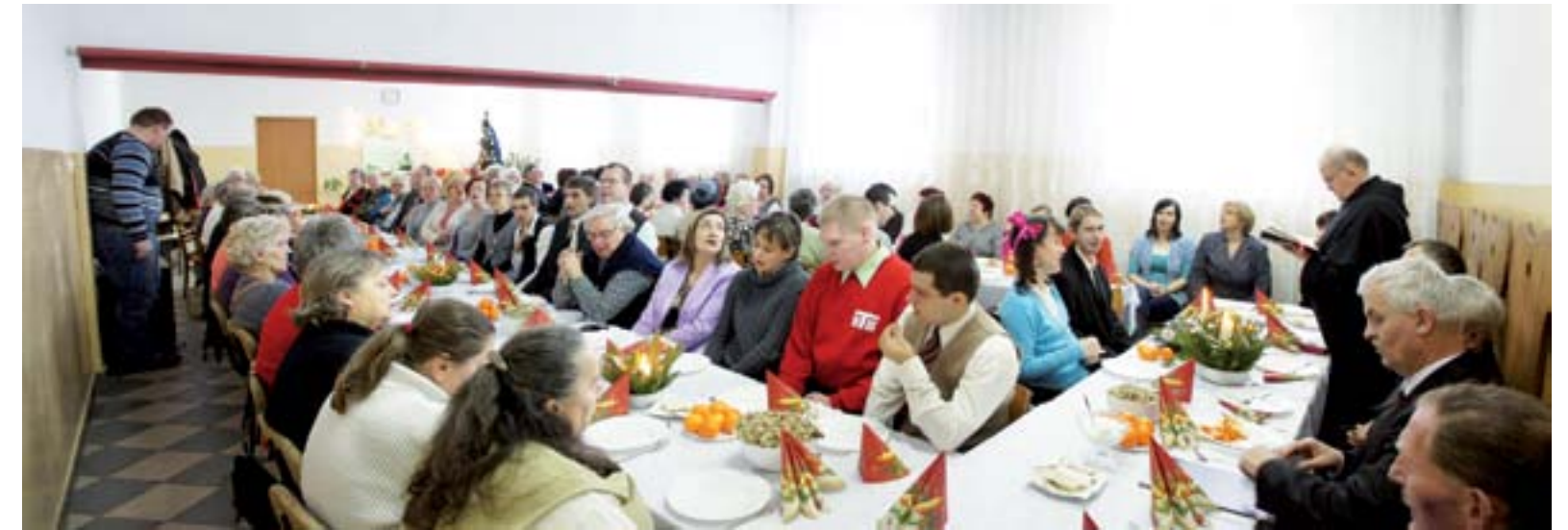
Darłowski MOPS zorganizował spotkanie opłatkowe dla osób niepełnosprawnych i seniorów.