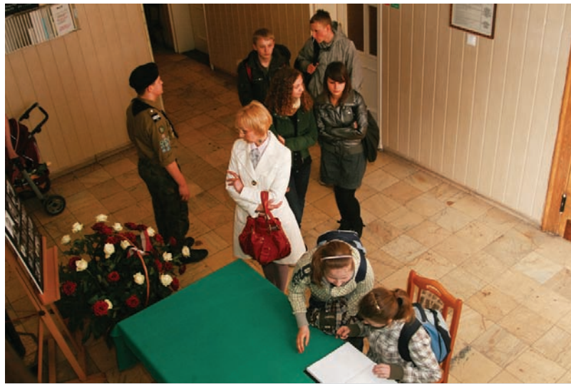
Do księgi kondolencyjnej wpisywali się darłowscy reprezentujący wszystkie pokolenia.