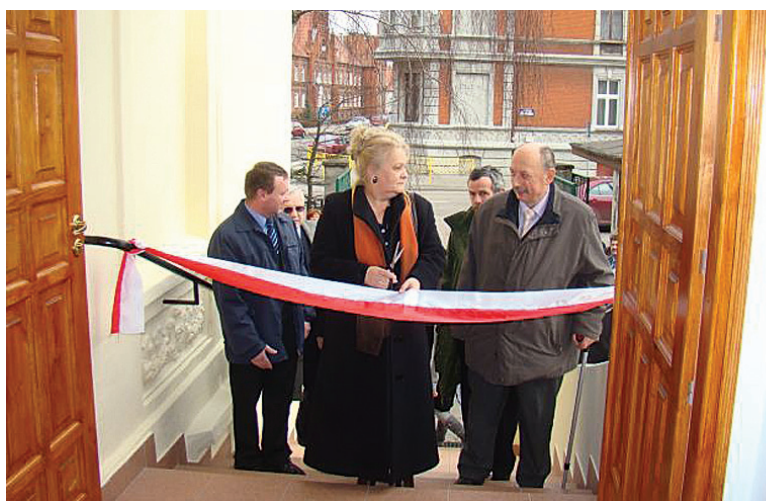
O przecięcie wstęgi zostali poproszeni władarze miasta i gminy Darłowo.

Od 22 marca w Darłowie są załatwiane wszystkie najważniejsze sprawy, jakie do tej pory wymagały wyjazdów do Sławna. Dotyczy to wydziałów komunikacji i dróg, architektury, budownictwa, rolnictwa i ochrony środowiska oraz wydziału geodezji, kartografii, katastru i go-