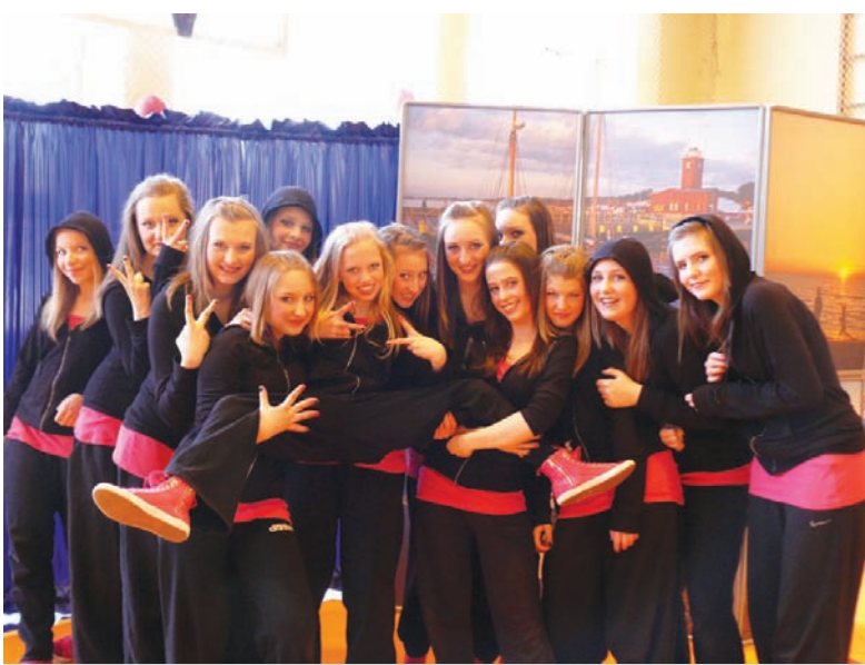
Najlepszy zespół przeglądu - grupa ADHD - na codzień trenująca w szkole tańca w hotelu Apollo w Darłóweku.