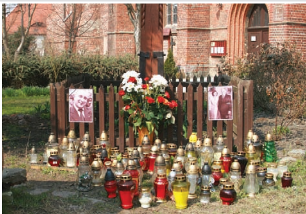
Pamiątkowe eptafia: przy pomniku rybaka oraz przy kościele mariackim.