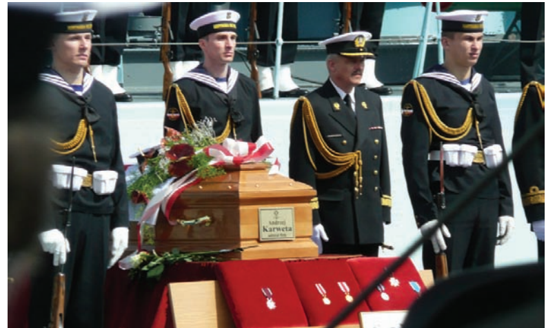
26 kwietnia 2010. Trumna z ciałem admirała floty Andrzeja Karwety (awansowanego na ten stopień pośmiertnie) stanęła przed okrętem - muzeum ORP Błyskawica w Gdyni, gdzie odprawiono mszę żałobną.