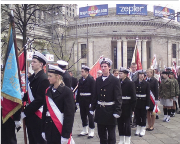
Darłowska młodzież przed pogrzebem pośła Gosiewskiego. Na pierwszym planie uczniowie szkoły morskiej, w głębi poczet sztandarowy liceum i harcerze.