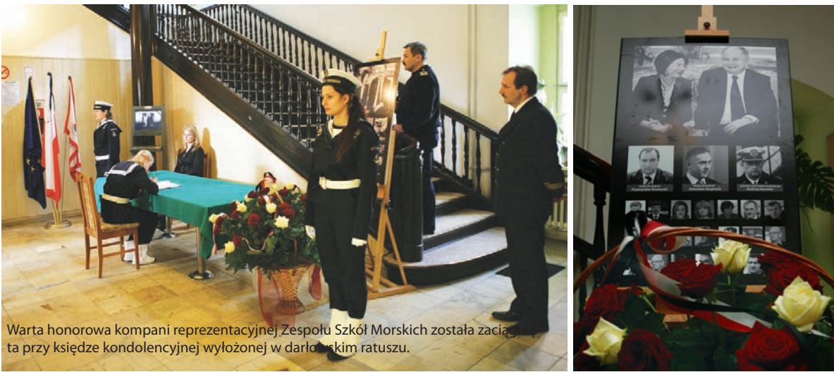
Warta honorowa kompani reprezentacyjnej Zespołu Szkół Morskich została zaciągana przy księdze kondolencyjnej wyłożonej w darłowskim ratuszu.