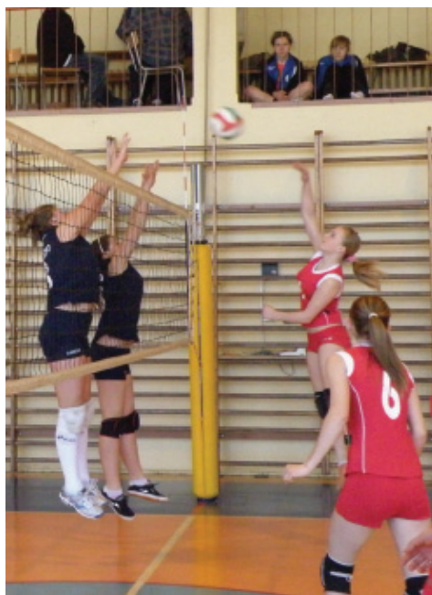
Młode siatkarki OSiR Darłowo (od lewej) podczas meczu. Tekst i foto: W. Śmigieński

acji praktycznie od podstaw stworzył sekcję dziewczęcej siatkówki. Opracowano system szkolenia z zespołem młodziczek grającym w lidze wojewódzkiej i zapleczem w postaci zespołów występujących w rozgrywkach minisiatkówek już od IV klasy szkoły podstawowej. Jednak już wkrótce dyrektora OSiR czekają trudne decyzje. Pięć młodziczek osiągnie w tym roku wiek kadetek. Czy kadrowo i finansowo stać będzie klub na utrzymanie dwóch zespołów? Czy zdecydować się na jeden zespół i przerwać ciągłość szkolenia? Decyzję trzeba będzie podjąć jeszcze przed początkiem kolejnego sezonu czyli już jesienią.