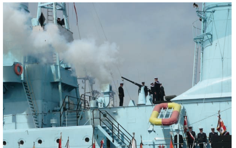
Dowódcę Marynarki pożegnały salwy armatnie z ORP Błyskawica.