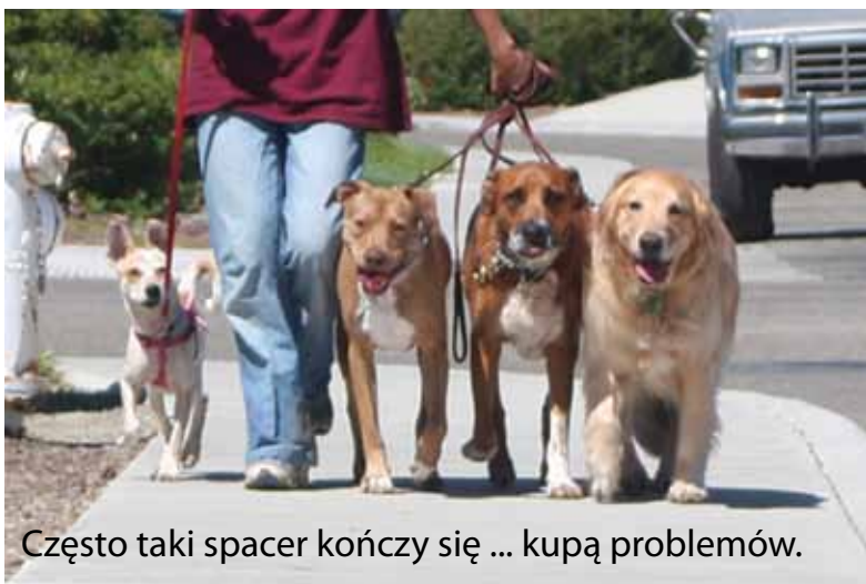
Często taki spacer kończy się ... kupą problemów.

W Darłowie obowiązki właścicieli psów określa „Regulamin utrzymania czystości i porządku na terenie