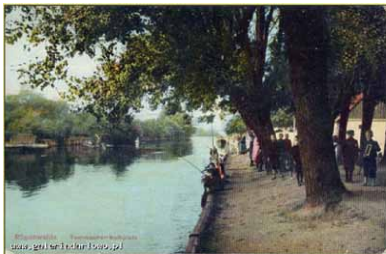
Wędkarze nad Wieprzą. Rok 1919. Fotografia pokazuje okolice koło obecnego pensjonatu „Nad Wieprzą” przy ul. Romualda Traugutta. Obecnie rzeka w tym miejscu jest znacznie zwężona a brzeg zamulony. Po odtworzeniu stanu pierwotnego do brzegu będą mogły dobiegać łódki.

Burmistrzowi udało się również przekonać dyrektora Płowensa do udrożnienia rzeki Wieprzy na miejskim odcinku między jazem a kładką „kutrowską”. Melioranci przygotowują dokumentację techniczną na remont i odbudowę urządzeń hydrotechnicznych. Oznacza to, że na miejskim odcinku Wieprza zostanie