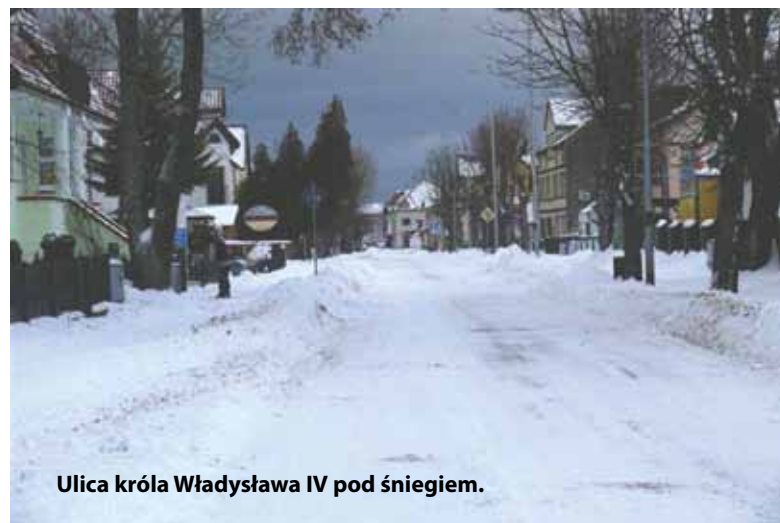
Ulica króla Władysława IV pod śniegiem.

Kolejne ulice w Darłówie Zachodnim zostaną przebudowane częściowo za unijne pieniądze. Do darłowskiego ratusza dotarła niedawno informacja o przyznaniu dotacji w wysokości półtora miliona złotych na inwestycję polegającą na modernizacji wymiennych w tytulie ulic.