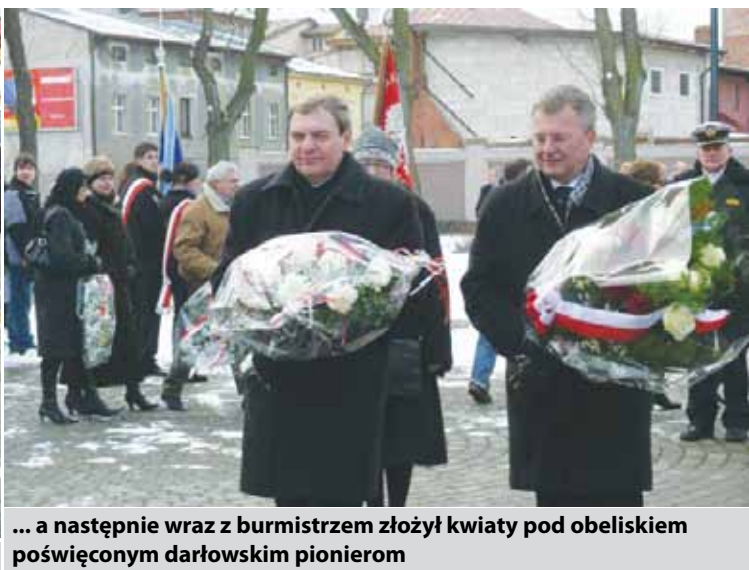
... a następnie wraz z burmistrzem złożył kwiaty pod obeliskiem poświęconym darłowskim pionierom