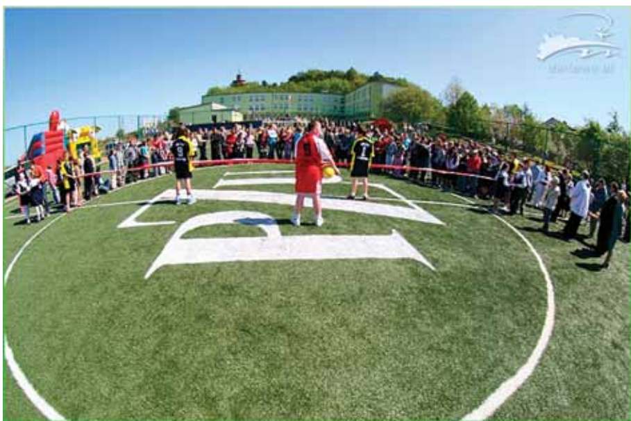
Otwarcie boiska ze sztuczną trawą przy SP3 w kwietniu 2009 roku. W maju ubiegłego roku miasto oddało również do użytku kompleks sportowy Orlik 2012 przy darłowskim liceum. Euroboisko będzie trzecim w Darłowie boiskiem piłkarskim ze sztuczną nawierzchnią.

Murawa ze specjalnym systemem odwadniającym będzie miała wymiary 68 x 105 metrów. Za linią autu będzie dwumetrowa opaska wzdłuż dłuższej krawędzi boiska i trzynie-