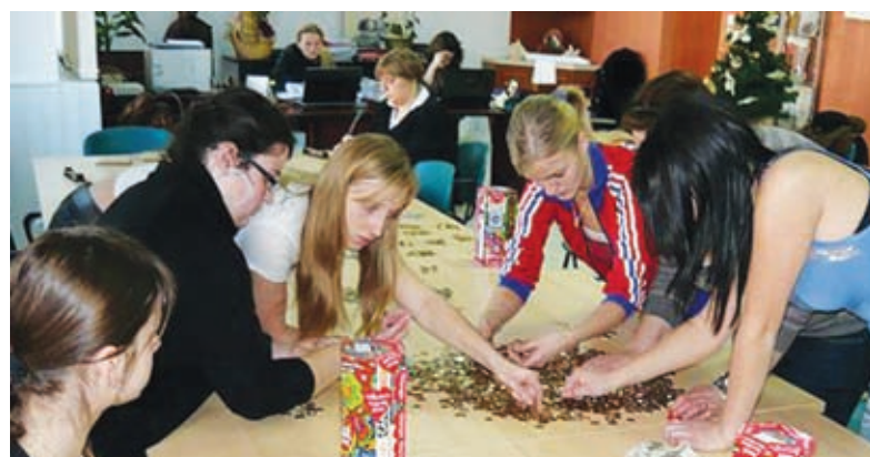
Liczenie zebranych pieniędzy przez wolontariuszy Wielkiej Orkiestry zgromadzonych w sztabie w liceum.