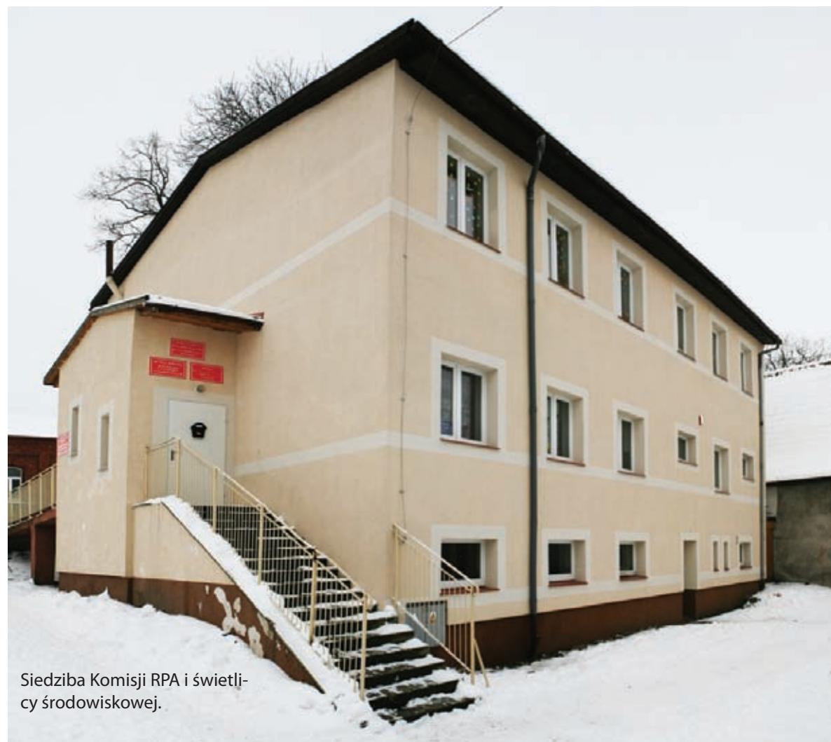
Siedziba Komisji RPA i świetlicy środowiskowej.

sytuację. Działania takie nie wyręczą jednak właścicieli sklepów z ich obowiązków.