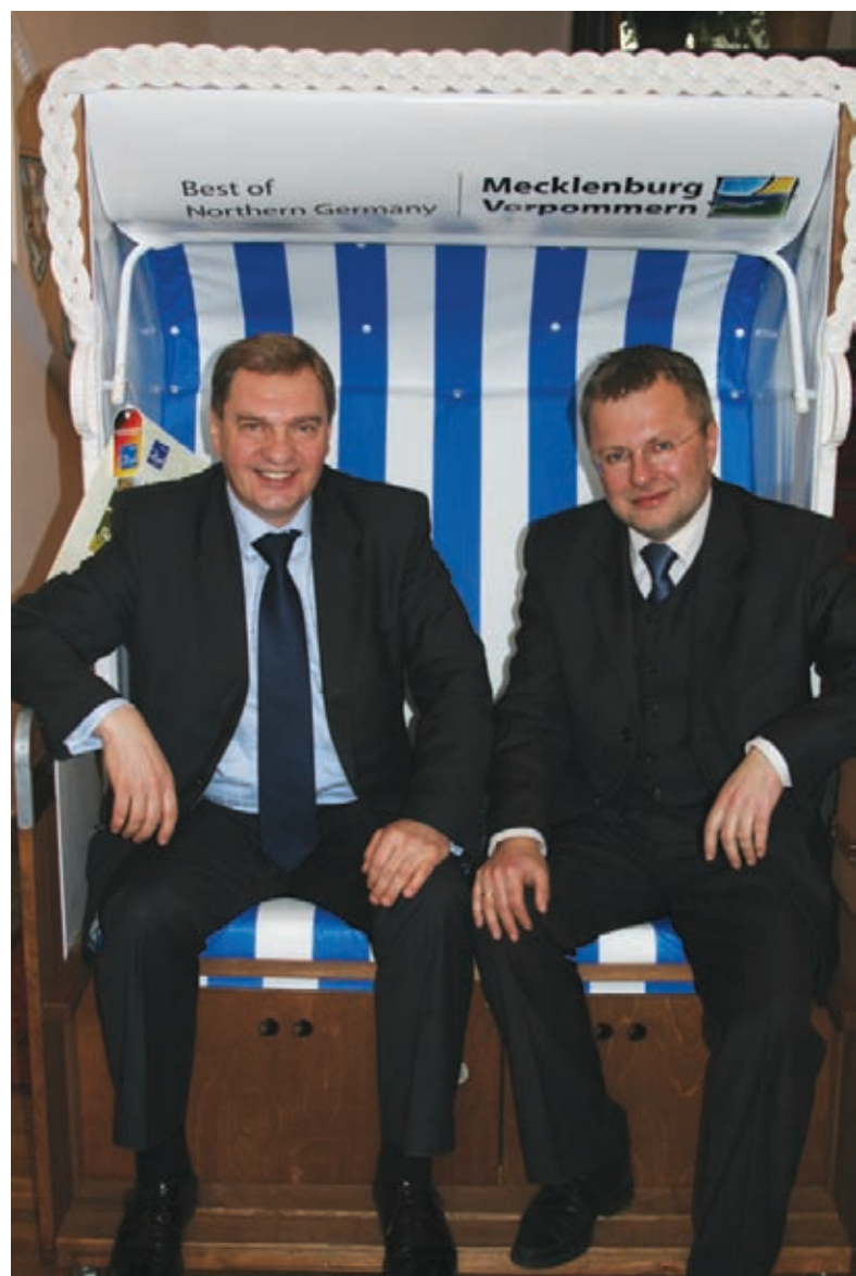
Marszałek Władysław Husejko przeznaczył na licytację nowoczesny kosz plażowy otrzymany od premiera Meklemburgii. Burmistrz Klimowicz osobiście odebrał prezent.

W oczekiwaniu na przyjaciół dzieci prosimy o kontakt telefoniczny Nr tel. 0943146648 lub 603174582