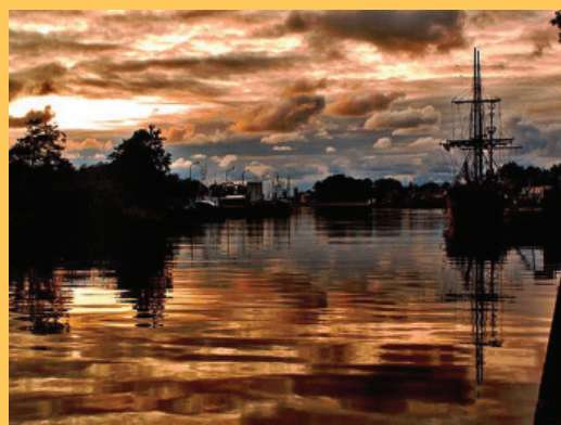
Darłowo