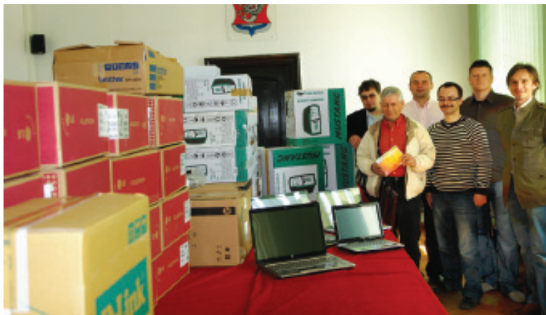
W ramach Zintegrowanego Programu Operacyjnego Rozwoju Regionalnego miasto otrzymało dofinansowanie w wysokości 75 procent do zakupu sprzętu komputerowego na realizację projektu „Wirtualny urząd - przyjazny e-urząd”.

• 16 lutego odebrano boisko ze sztucznej trawy przy Szkole Podstawowej nr 3 wybudowane w ramach programu „Blisko Boisko”, kosztem