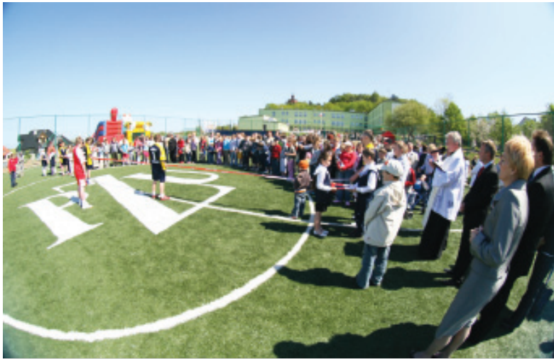
Nowoczesne boisko ze sztuczną trawą zbudowane przy szkole podstawowej nr 3 w ramach programu „Blisko Boisko”.