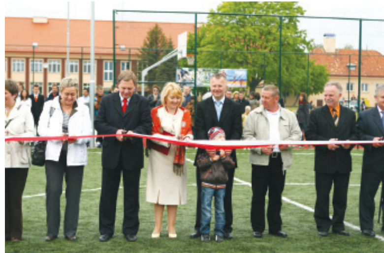
Otwarcie kompleksu boisk Orlik 2012 przy Zespole Szkół im. Stefana Żeromskiego. W uroczystości wzięły udział marszałek Władysław Husejko.

• 16 maja Darłowo wzbogaciło się o zespół boisk Orlik Darłowo. Kompleks sportowy został wybudowany w ramach rządowego programu „Moje Boisko - Orlik 2012”, kosztem 1,3 mln zł.