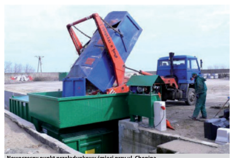
Nowoczesny punkt przeładunkowy śmieci przy ul. Chopina