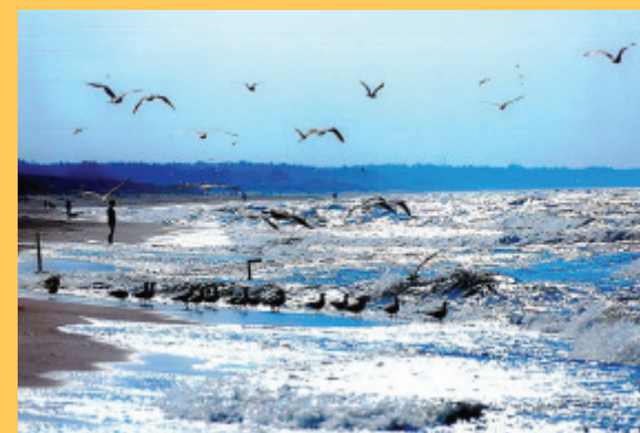
Ząbeki