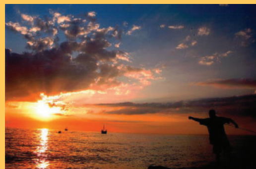
Bielawa